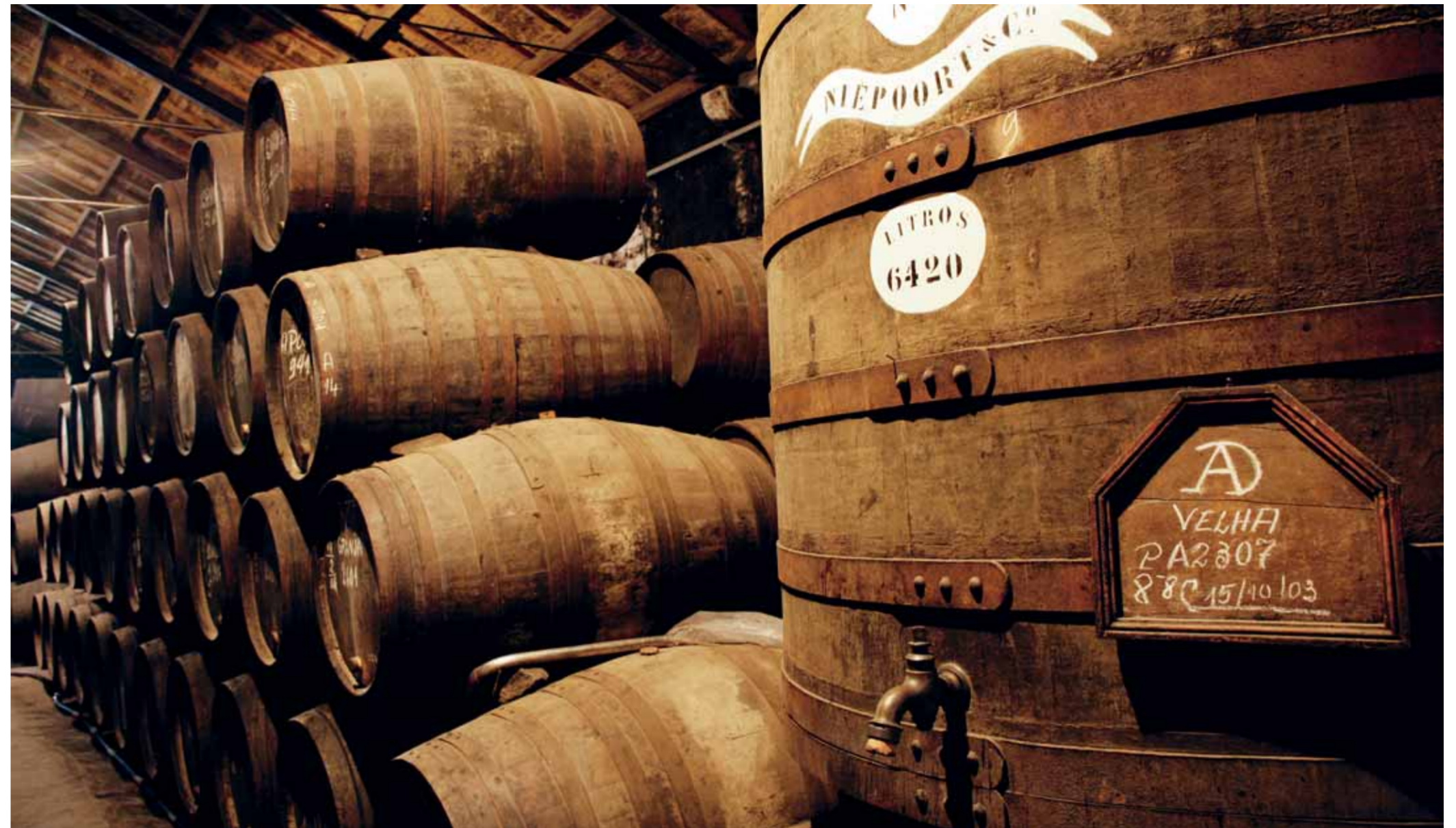
Tradition seit 1842: Portweinkellerei Niepoort

Der toskanische Süßwein Vin Santo hat seinen Namen wohl daher, dass man ihn früher nur an „heiligen“ Tagen wie Weihnachten oder Ostern trank. Für Vin Santo werden hochreife weiße Trauben – Grechetto, Malvasia, Trebbiano – zum Trocknen in einem gut belüfteten Gebäude, der „Vinsantaia“, auf Strohmatten ausgelegt, bis sie rosinenartig geschrumpft sind. Bis zum folgenden Frühling verdunstet Wasser, während sich Zucker und Aromen in den Beeren konzentrieren. Nach dem schonenden Pressen kommt der Most zur