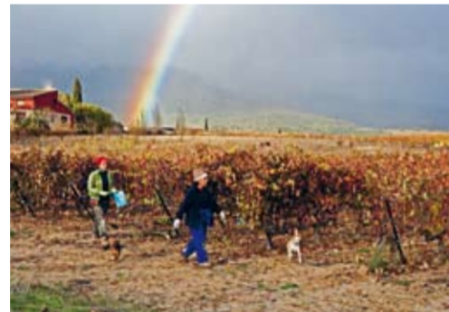
Herbstliche Weingartenarbeit in der Rioja.

Die Familie Eguren ist seit 1870 im Weinbau tätig und gehört heute zu den Platzhirschen in der Rioja. Vom einfachen Alltags-Rioja bis zum mächtigen 100 €-Wein produziert sie in mehreren Kellereien