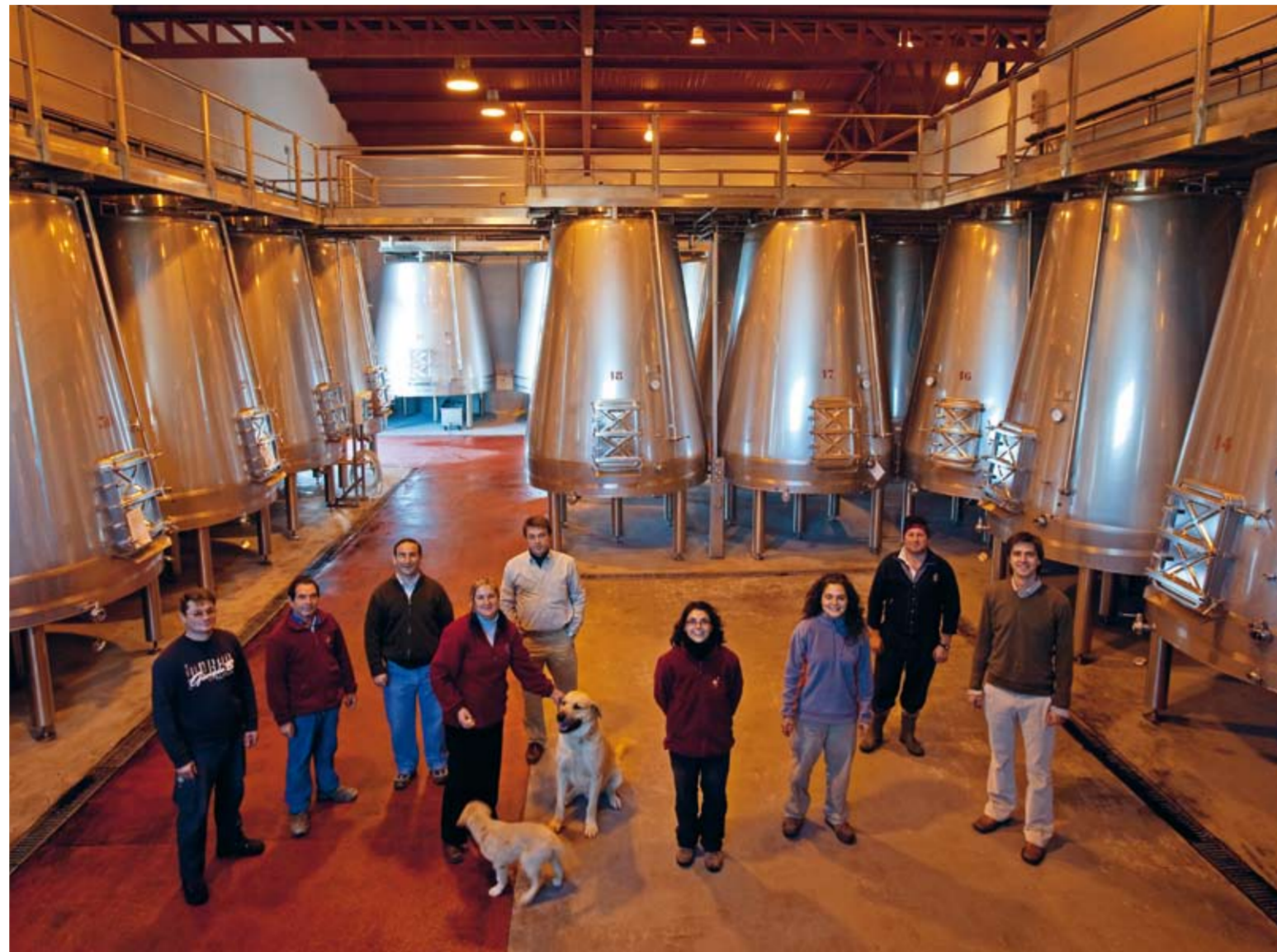
Das Team von O. Fournier, Ribera del Duero.

Ein ungewöhnlicher, atypischer spanischer Cava: aus 100% Pinot Noir-Trauben, frische Kräuter, feiner rotbeeriger Duft: Kirschen, Erdbeeren, dazu Anflüge von Honig, Toastbrot und Blüten. Am Gaumen frisches, intensives, cremiges Moussieren, fruchtig. Als sehr eleganter Aperitif bzw. zu Tapas, Pasta, Fisch, asiatischer Küche. Sollte bei 7–8°C getrunken werden.