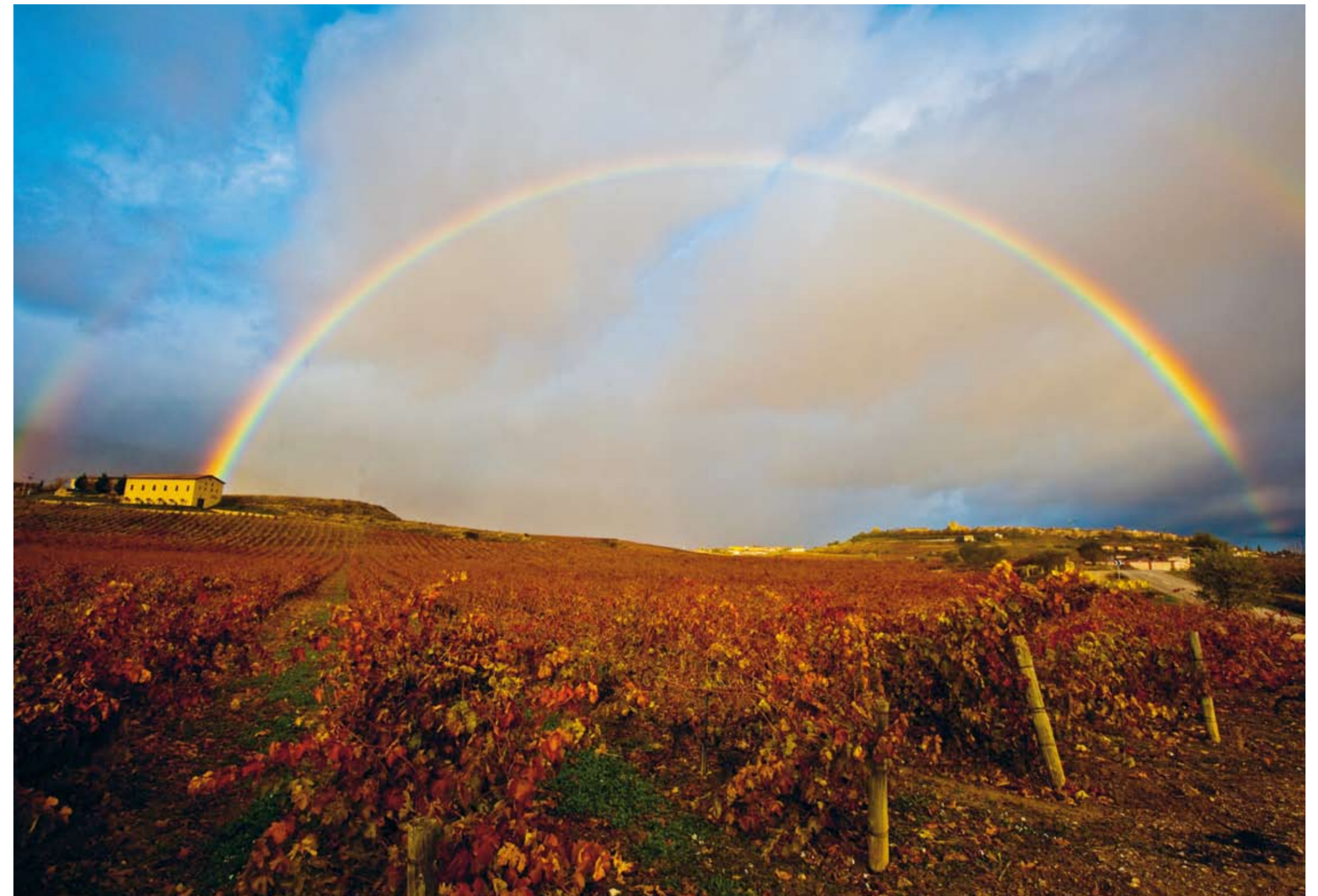
Regenbogen über dem Weingut Sierra Cantabria, Rioja